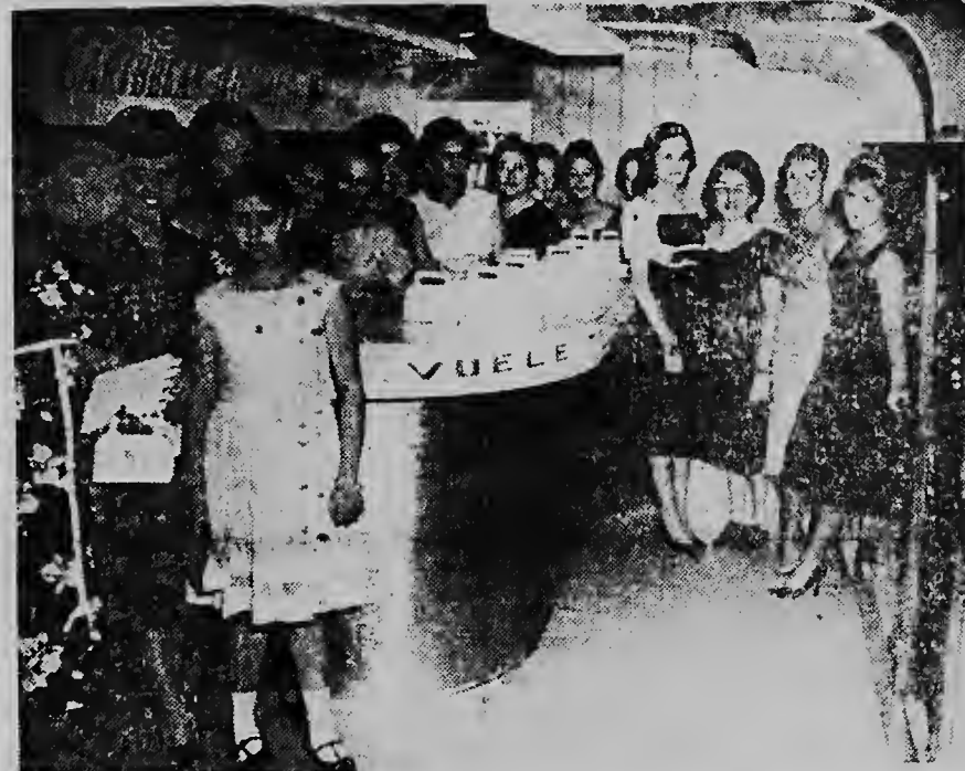
Na New York y na Puerto Rico Trans Caribbean tin busnan grandi di propaganda riba caminanan na unda e publico por haya tur clase di informacion tocante viajenan cu T.C.A. Na Pto. Rico mas di mei millon hende a bishita e busnan aki caba. Aki nos ta mira algun dama portoriqueno di oficinanan turistica (na drechi dos stewardess di T.C.A.) den e bus, kende posibel lo bin pasa algun dia na Aruba.